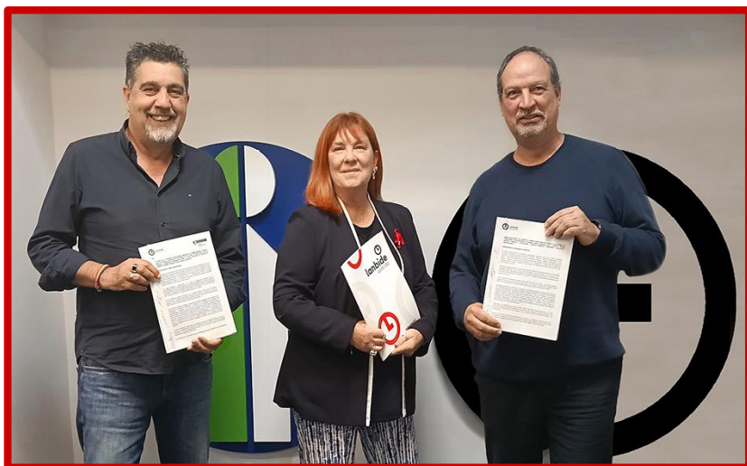
Los Delegad@s de UGT Lanbide muestran su satisfacción tras la firma del Acuerdo.

UGT FIRMA EL ACUERDO PARA LA RPT DE LANBIDE